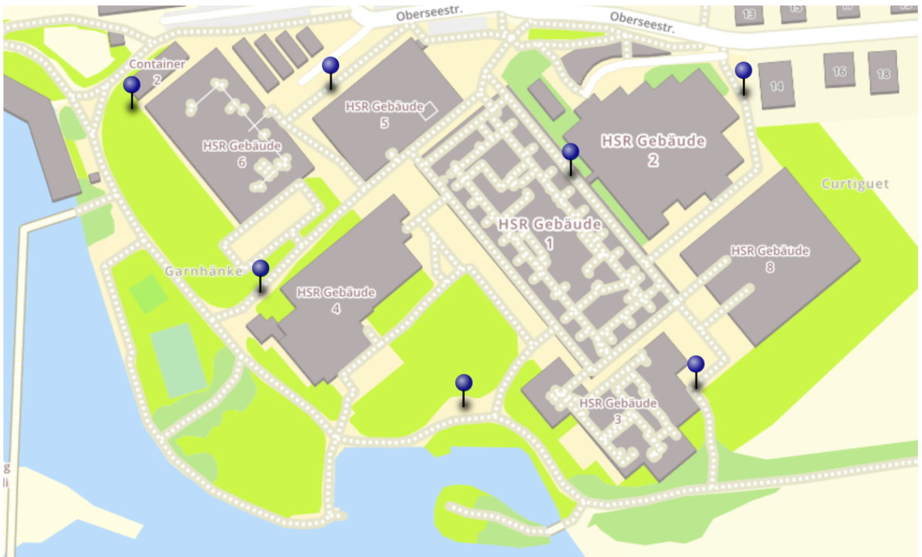
Abbildung 1. Interaktive Karte des Postenlaufs. Link

der alle Posten verzeichnet sind. Anhand der Karte sollen die Posten gefunden und die dortigen QR-Codes eingescannt werden. (Falls das Scannen nicht funktioniert, hat es auch eine URL, die man abtippen kann.) Auf der erscheinenden Website findet man Fragen, die mit dem Erfassungsformular zu beantworten sind. Danach geht es weiter zum nächsten Posten.